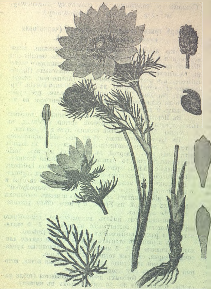
Адонисъ, горицвѣтъ, черногорка, Adonis vernalis . (Лепестки цвѣтка золотисто-желтые).

Соплодіе сухое, состоитъ изъ расположенныхъ спиралью на коническомъ ложѣ многочисленныхъ морщинистыхъ, сѣровато-зеленыхъ оршиковъ , обратно-яйцевидной формы, съ загнутыми, клювовидными крючечками.