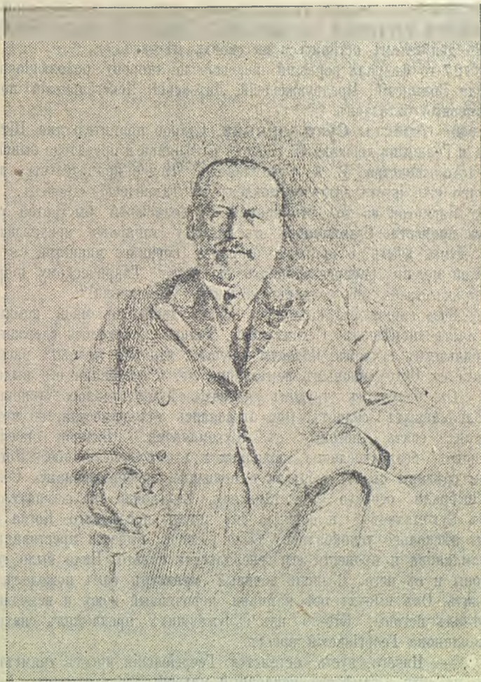
М. В. Родзянко.

Подписали предсѣдатель комитета Думы Родзянко, Исполнительный комитетъ Совѣта рабочихъ и солдатскихъ депутатовъ.