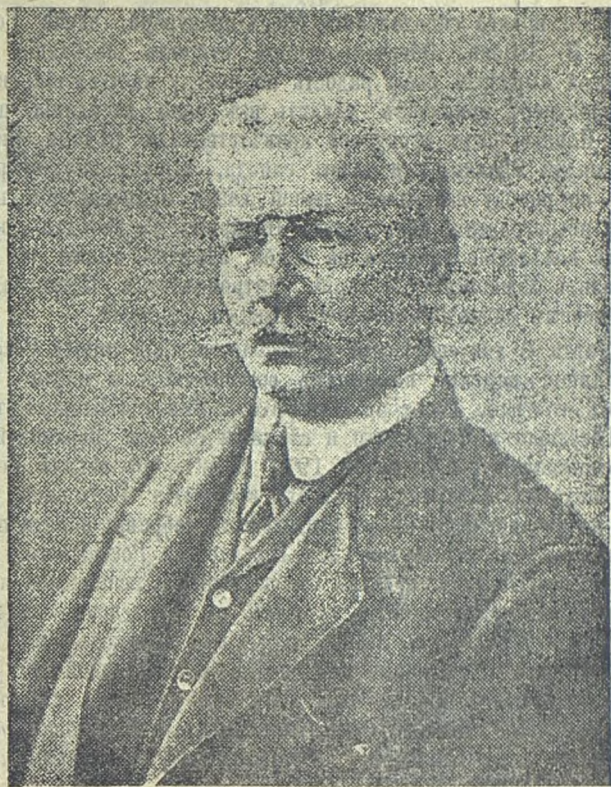
П. Н. Миллюковъ.

◆ Старые министры и наши враги. П. Н. Миллюковъ, говоря о своемъ назначеніи на постъ министра иностранныхъ дѣлъ, заявилъ: „Быть-можетъ, на этомъ посту я окажусь и сла-