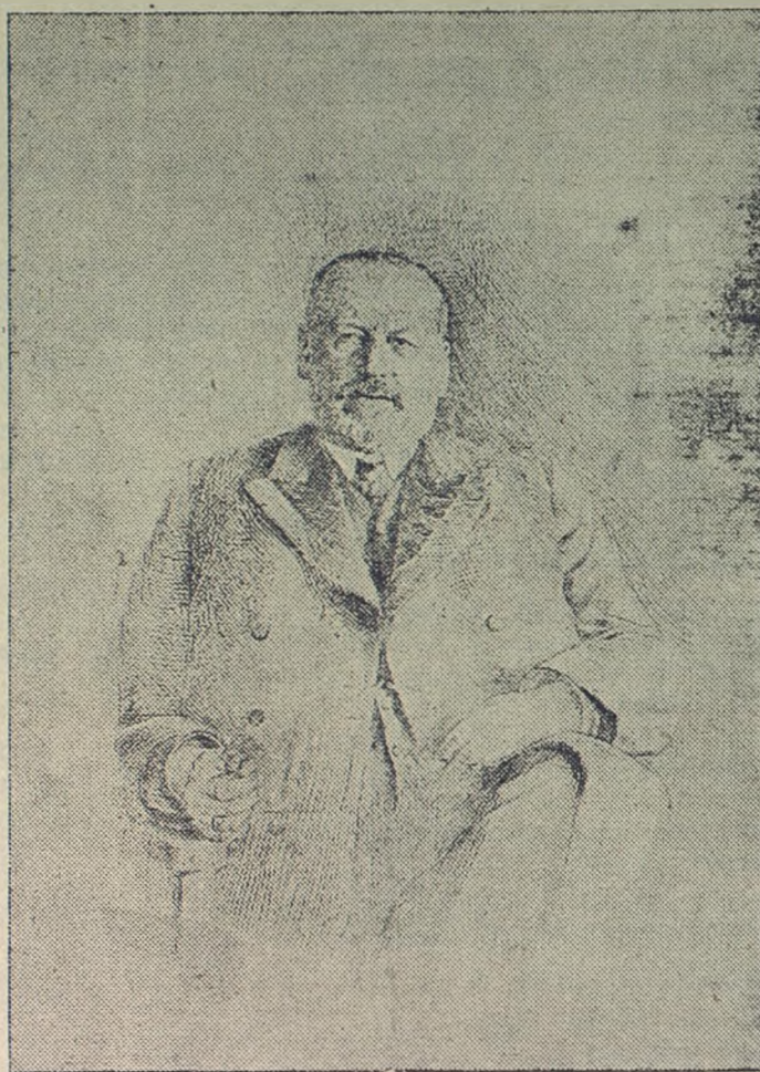
М. В. Родзянко. Председатель Государственной Думы.